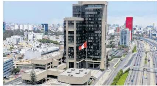
Panorama. Petroperú se encuentra en proceso de reestructuración desde inicios del año.

"Lo importante aquí es cómo se va a reemplazar la deuda de corto plazo. Esa es una medida sustancial. Solo po-